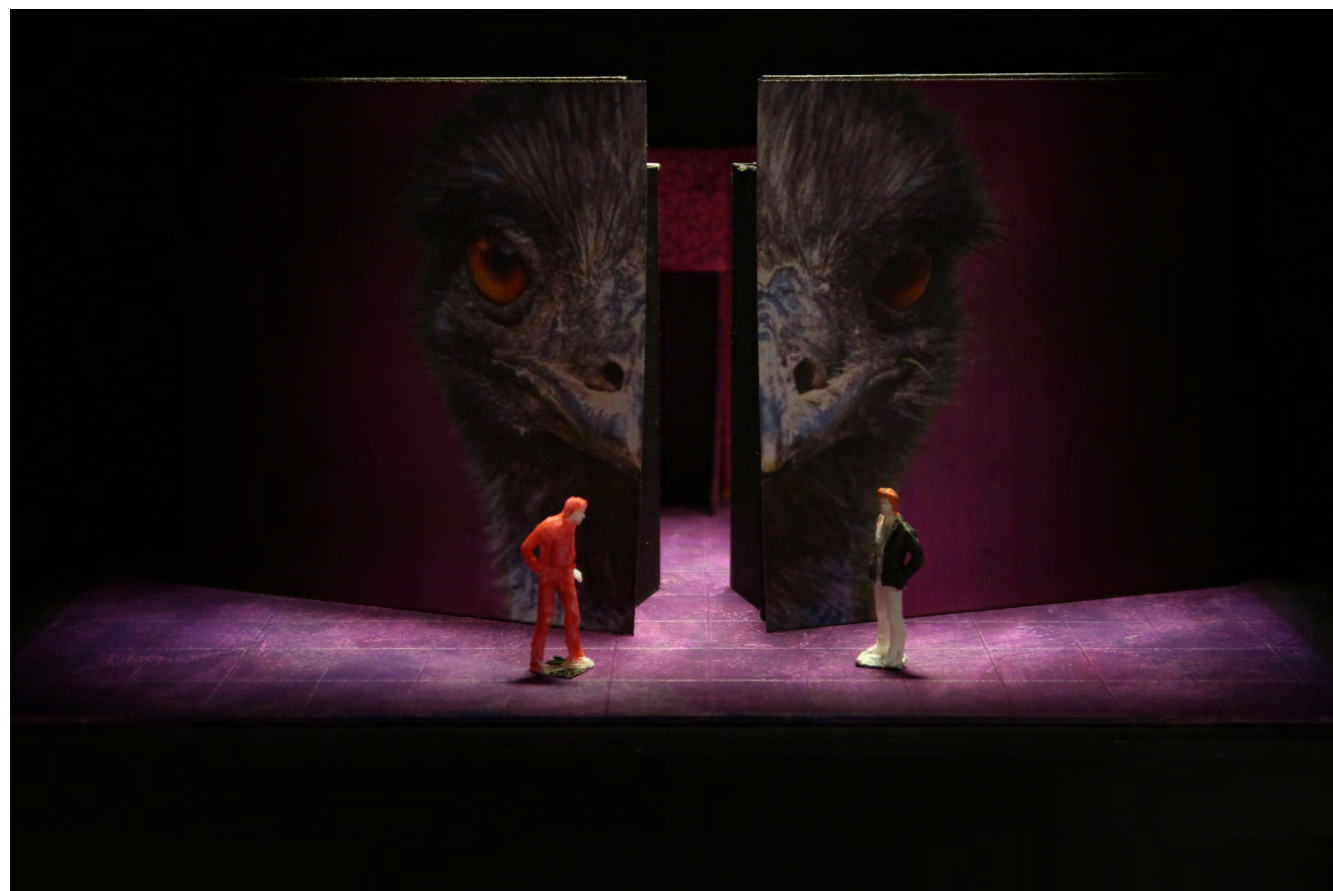
Photos de la maquette scénographie, septembre 2024