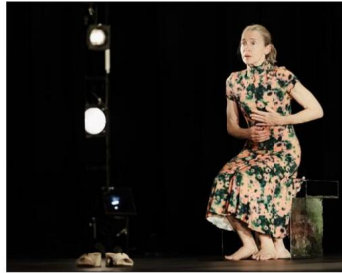
César du meilleur second rôle féminin dans Tous les matins du monde , Anne Brochet s'est exclusivement tournée depuis plus de vingt ans vers l'écriture et le théâtre. Avec Odile et l'eau , elle présente son premier seule-en-scène.

D'Ondine, pièce de Jean Giraudoux que toutes les jeunes actrices rêvent d'interpréter, c'est aujourd'hui quinquagénaire qu'Anne Brochet entre dans la peau d'Odile. « C'est une brave qui va de l'avant, qui est seule et qui nage afin de se